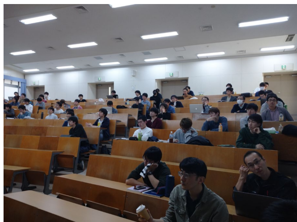
写真2：各グループの発表を熱心に聞く先生と学生たち。

各グループ（3人～6人）ごとに一人当たり2枚から3枚程度のスライドを使って協力して発表を行いました。発表12分+質疑応答3分という短い持ち時間でしたが、どのグループも発表内容の選別と発表の仕方を上手に工夫し、時間内に大事なポイントをわかりやすく説明してくれました。